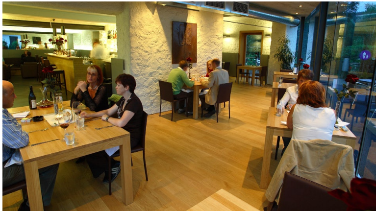
Unter dem Motto „So schmeckt der Herbst“ lädt das Leobacher in Mattsee zum Genießen ein.

Das Leobacher in Mattsee bietet kulinarische Spezialitäten zu vernünftigen Preisen: Erdäpfelwochen sowie Kürbis- und Wildspezialitäten bis Ende Oktober